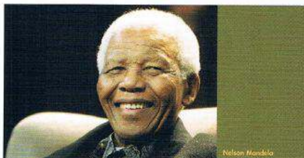
Madiba - Het levensverhaal van Nelson Mandela

Ik hoop dat Mandela's levensverhaal de weg naar veel harten zal vinden; van jong en oud! ■